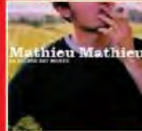
MATHIEU MATHIEU La gloire est morte (Milagro / Outside)